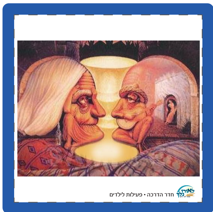
חדר הדרכה • פעילות לילדים