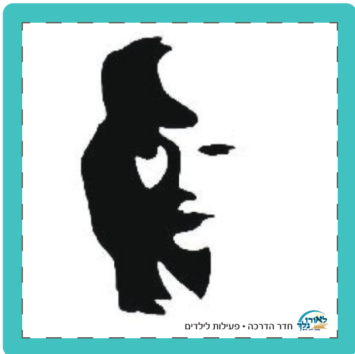
חדר הדרכה • פעילות לילדים