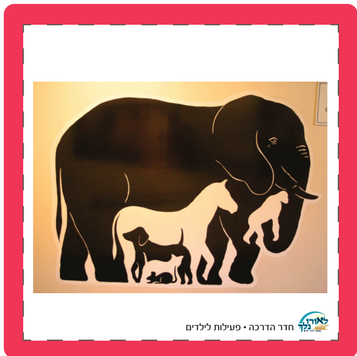
חדר הדרכה • פעילות לילדים