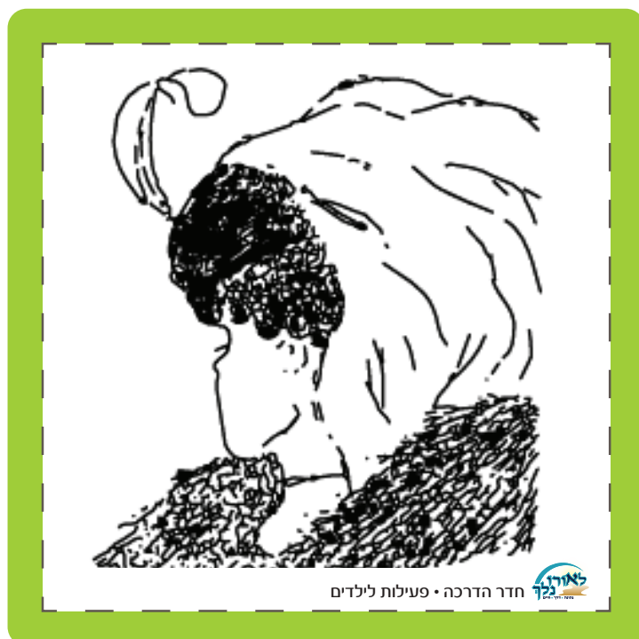
חדר הדרכה • פעילות לילדים