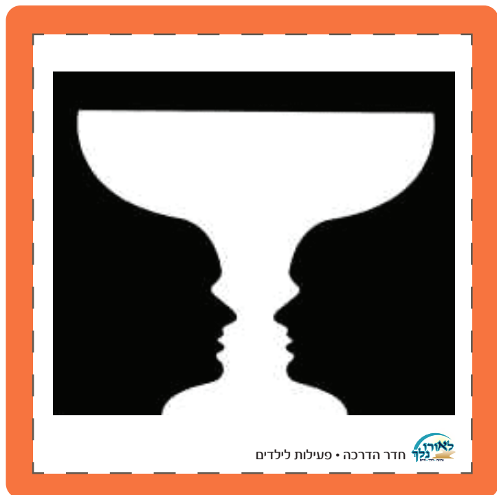
חדר הדרכה • פעילות לילדים