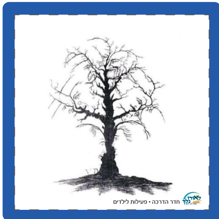
חדר הדרכה • פעילות לילדים